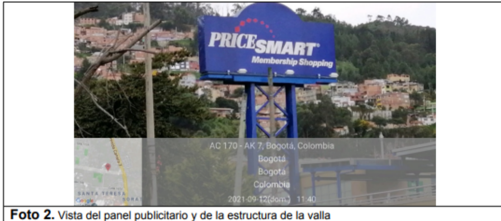
Foto 2. Vista del panel publicitario y de la estructura de la valla